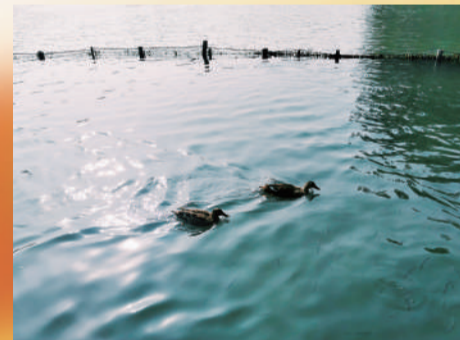
《嬉戏》 办公室 金莉燕