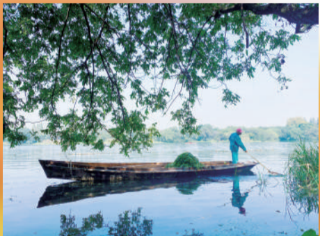
《环境美容师》 明日控股 俞涛