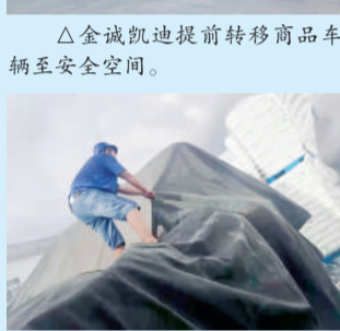
△新光公司工人给堆放在露天的塑料原料和成品覆盖篷布,做好塑化产品防水工作。