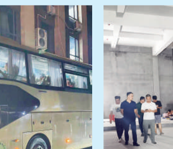
△浙农实业横店项目转移全部施工人工至一期店铺安全地点暂时安置。