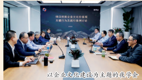
以企业文化建设为主题的夜学会

明日控股党总支(2021年2月26日成立党委)于2018年7月开始探索推行夜学会制度,参加人员由明日党委(党总支)成员及班子成员组成,每月不定期开展,主题形式不一。通过每月夜学的形式,明日控股党委把强化理论武装与企业经营管理相结合,在重要改革发展事项决策上时刻对标党中央决策和国家战略,指引企业在理论和实践上不断取得突破。