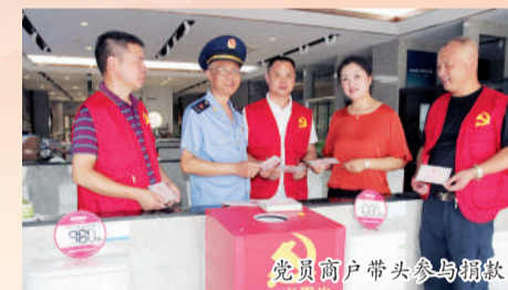
党员商户带头参与捐款

浙农实业党支部创新专业市场治理模式,由党员商户带头在商铺内划出大约半平方米专门用于陈列活动商品和捐款箱,每卖出一件活动商品便从中提取利润放入捐款箱,相关捐款专门用于公益慈善活动,引导全体商户提高诚信意识、打造和谐市场。浙农实业党支部将抓党建与兴市场相融合,通过党员的模范带头作用,提升市场商户的凝聚力与向心力,加强彼此交流,共谋兴市强企,真正做到党的建设与市场运营有机融合、互促互进。