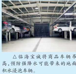
△临海宝诚将商品车辆吊高,预防强降雨可能带来的地面积水浸泡车辆。