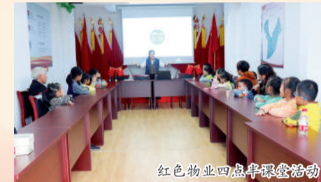
红色物业四点半课堂活动

华都股份党总支结合下属物业公司现有资源和管理实际,建立了党建引领的基础联动机制,打造突出红色属性和内容、富有知识性和故事性的红色示范基地,设置物业线上、线下服务功能组织,把物业服务与党的宣传教育融为一体,并组建志愿者服务队开展特色服务,通过党建引领业主、社区、居委会和物业“四方关系”,着力解决传统物业管理中的难点问题,构建了和谐邻里关系,为基层治理贡献力量。