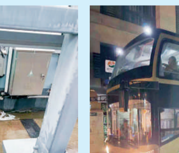
△浙农实业浦江项目安排车辆转移全部施工人工共229人,原宿舍断电清空。