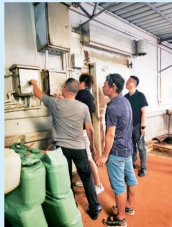
△石原金牛检修人员检查工厂配电箱,消除可能出现的断电隐患。