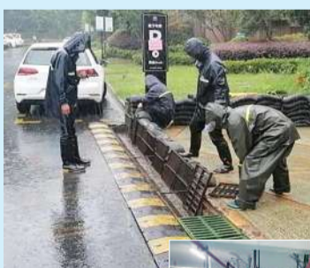
△华都华悦物业人员在小区地下车库入口安装挡水板,同时利用沙袋加固小区地下车库重点区域。