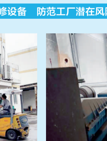
△茂阳员工检查厂内发电机运行,确保特殊情况下能立即发挥作用。