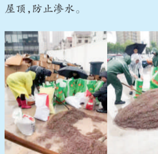
△东阳宝顺4S店工作人员在雨中封装沙袋,加固各个隐患点,防范积水。