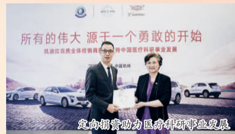
定向捐赠助力员工创新创业发展

金诚汽车党支部把党建融入企业发展,承担社会责任等方面,组建党员骨干为主的汽车售后服务队,为客户提供优质高效服务;成立“爱心基金”回馈社会,资助助学、热心公益、情暖职工;倡导“最美金诚人”品格,挖掘好人好事引导正能量,培植最美风景;培养“金诚工匠”,形成了“培养一名党员、树立一面旗帜、带动一片职工”的经营管理模式,燃起员工创业激情;设立“汽车之家党员活动阵地”,展示党员形象、打造学习园地、激活红色细胞;建设“党建品牌文化墙”,让党员在群众中亮身份、树形象、强监督,提升组织影响力、吸引力、凝聚力和号召力。