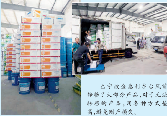
△宁波金惠利在台风前转移了大部分产品,对于无法转移的产品,用各种方式垫高,避免财产损失。