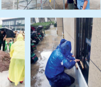
△温州虹元商管工作人员为天元广场商铺加固门窗,安装挡板,防止雨水进入室内。

△台风期间,宁波宝顺后门被风吹开,员工用轮胎、木板等对被风吹开的铁门进行隔档加固。