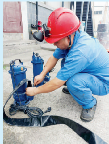
△杭州新光公司动力部检修生产车间防汛水泵,做好应急准备。